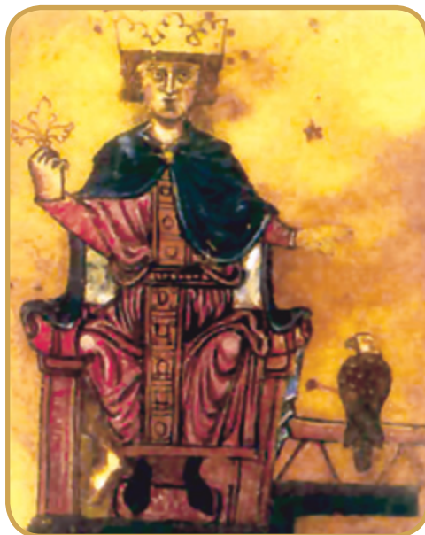
Φρειδερίκος Β΄ (Ρώμη, Βατικανή Βιβλιοθήκη).

Τρία χρόνια αφότου πέθανε η βασίλισσα Ειρήνη, ο Ιωάννης Βατάτζης νυμφεύθηκε την δωδεκαετή κόρη του Γερμανού αυτοκράτορα Φρειδερίκου Β΄ Χοενστάουφεν, Κωνσταντία. Ο γάμος αυτός ήταν μια καθαρά διπλωματική πράξη του Ιωάννη που προκάλεσε μεγάλη ανησυχία στον Πάπα και στον Φράγκο βασιλιά της Κωνσταντινουπόλεως. Ο αυτοκράτορας της Γερμανίας αποτελούσε το μαύρο πρόβατο της Δύσης για την «αγία έδρα» και, όπως αναφέρθηκε παραπάνω, κατά το παρελθόν απαγόρευσε τη διέλευση από την επικράτειά του φραγκικών δυνάμεων που εστάλησαν προς ενίσχυση της Κων-