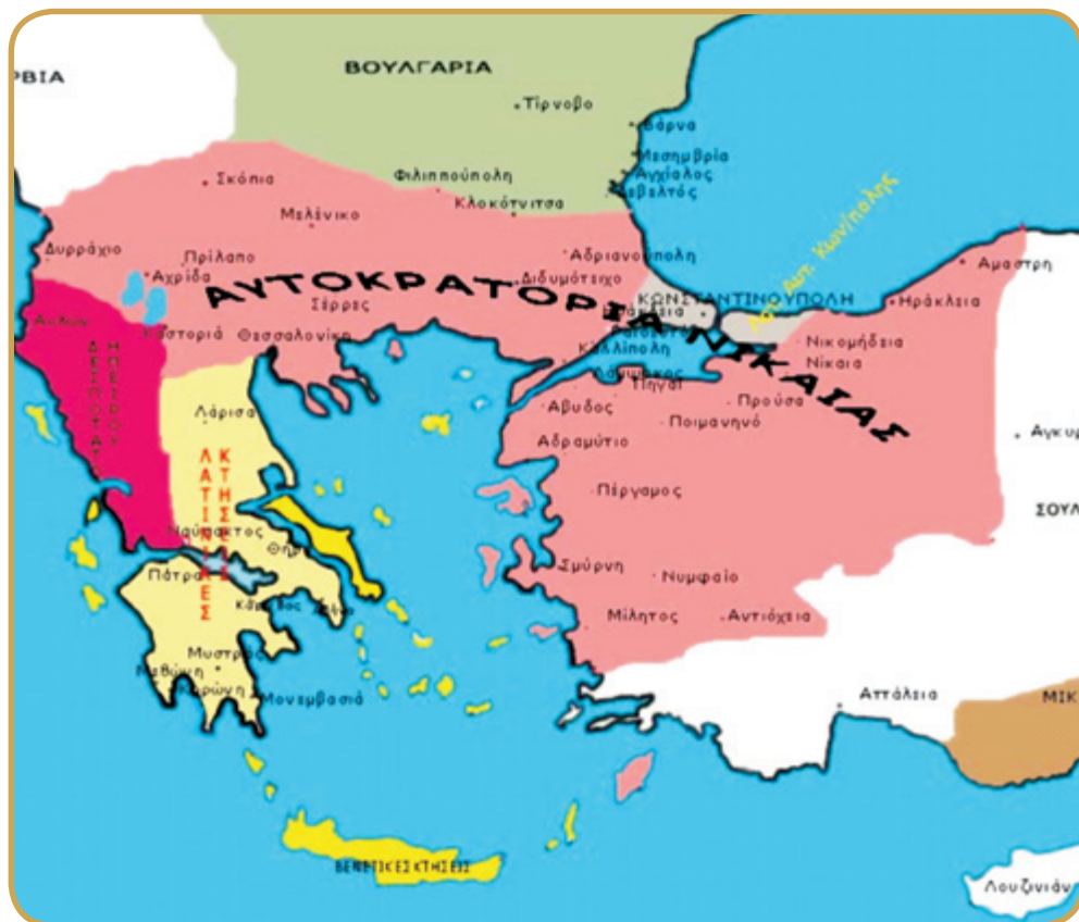
Χάρτης που καταδεικνύει τη διεύρυνση των συνόρων της Αυτοκρατορίας της Νίκαιας.

αποκατάσταση της Βυζαντινής Αυτοκρατορίας. Δυστυχώς οι εμφύλιες διαμάχες με τα άλλα Ελληνικά βασίλεια αλλά και οι εχθρικές μετακινήσεις άλλων φυλών, ανάγκασαν τον Ιωάννη να αλλάζει τα σχέδια του, που επικεντρωνόταν στην ανακατάληψη της βασιλεύουσας.