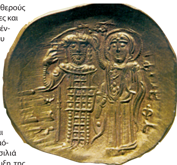
Νόμισμα του Ιωάννη Βατάτζη, (Αθήνα Νομισματικό Μουσείο).

Ο θάνατος του Ιωάννη Βρυένιου το 1237 και οι προτροπές του Πάπα για ένωση της Βουλγαρικής εκκλησίας στη Δύση, άνοιξαν την όρεξη του Ιωάννη Ασάν για την αντιβασιλεία στην Κωνσταντινούπολη, και καθώς έβλεπε ότι η δύναμη του Ιωάννη Βατάτζη αυξανόταν διαρκώς, αθέτησε τη συμφωνία συμμαχίας των δύο κρατών. Διέλυσε τον γάμο του Θεοδώρου και της Ελένης καθώς ζήτησε την κόρη