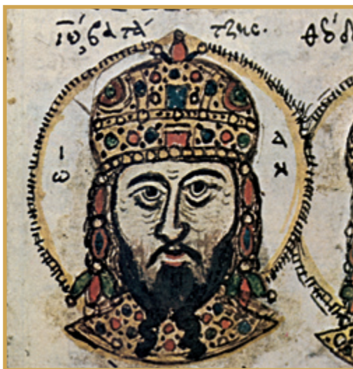
ΚΕΙΜΕΝΟ- ΦΩΤΟΓΡΑΦΙΕΣ: ΕΜΘ Επχίας (Ο) Ιωάννης Σαρσάκης