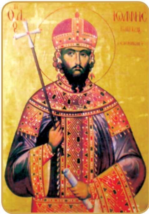
Η φορητή εικόνα του Άγιου Ιωάννη Δούκα Βατάτζη του Ελεήμονος (Δημιούργημα λαϊκής τέχνης, Ιερός Ναός Σωτήρος Χριστού Διδυμοτείχου).

Νυμφαίο. Ακολούθως, γράφτηκε από ανώνυμο συγγραφέα ή κατά πάσα πιθανότητα από τον επίσκοπο Πελαγονίας Γεώργιο (14 ος αιώνας) η βιογραφία του ως «Ο βίος του Αγίου Ιωάννου βασιλέως του Ελεήμονος». Ασματική ακολουθία του Αγίου Βασιλιά έγραψε ο Άγιος Νικόδημος ο Αγιορείτης, καθώς τον συμπεριέλαβε και στον συναξαριστή των δώδεκα μηνών που συνέγραψε ο ίδιος. Την ακολουθία του Αγίου Βασιλιά εξέδωσε το 1872 ο Σεβασμιότατος Εφέσου Αγαθάγγελος, που καταγόταν από τη Μαγνησία. Στην έκδοση αυτή συμπεριέλαβε εκτός από τη βιογραφία του Βατάτζη, που συνέγραψε ο Άγιος Νικόδημος, και μία άλλη βιογραφία πιο εκτενή ενός ανώνυμου συγγραφέα.