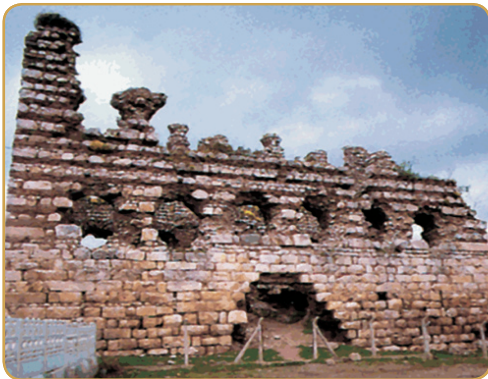
Ερείπια του ανακτόρου στο Νυμφαίο όπου πέθανε.

μεταγενέστεροι, κλασικοί βυζαντινολόγοι ξένοι αλλά και Έλληνες αναγνωρίζουν και εγκωμιάζουν το έργο του.