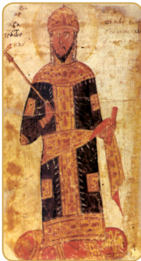
Θεόδωρος Β΄ Λάσκαρης.