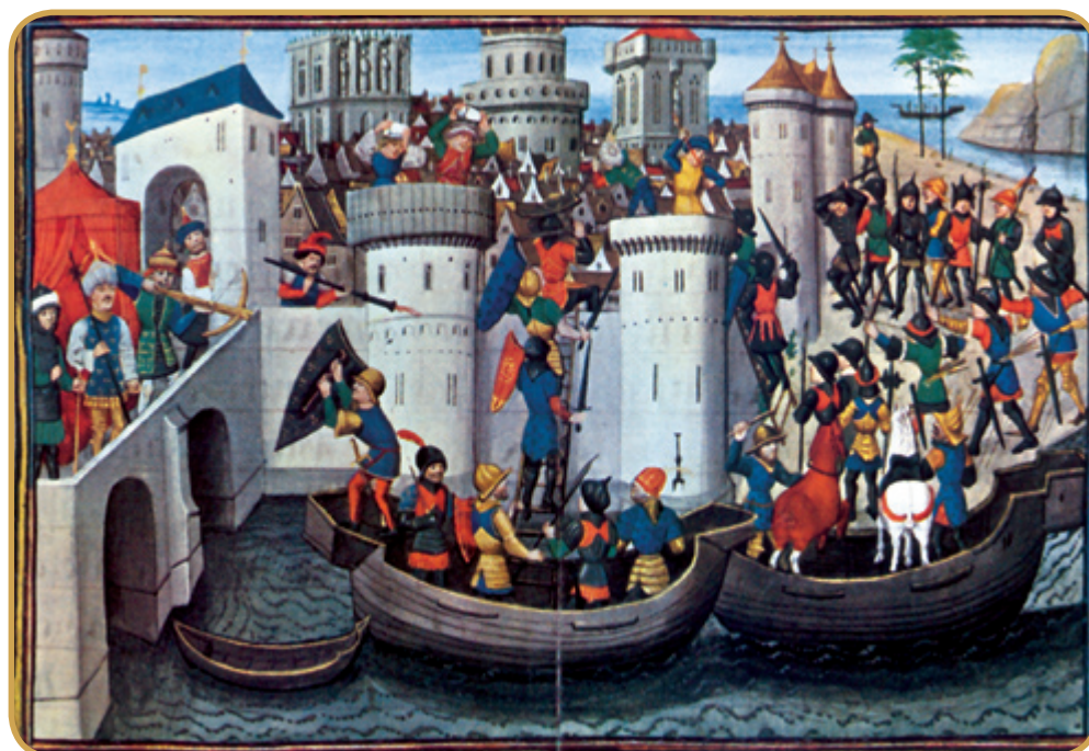
Η πολιορκία της Κωνσταντινούπολης από τους Σταυροφόρους σε μικρογραφία γαλλικού χειρογράφου του 15ου αιώνα.

Η άλωση της Κωνσταντινουπόλεως τον Απρίλιο του 1204 από τους Φράγκους της Δ΄ Σταυροφορίας, υπήρξε η συνταρακτικότερη στιγμή στην έως τότε ιστορία της Βυζαντινής αυτοκρατορίας. Συνέπεια αυτού του γεγονότος ήταν η ραγδαία αφύπνιση της ελληνικής συνείδησης, η οποία είχε αρχίσει να συντελείται ήδη από τον 6 ο αιώνα. Η δημιουργία ανεξάρτητων ελληνικών κρατιδίων ως κιβωτοί των ελληνορθόδοξων πληθυσμών, ήταν η κύρια αιτία που συνετέλεσε στην ωρίμαση και σύνθεση του νέου ελληνισμού. Τα πιο ισχυρά από τα νεοσύστατα κράτη ήταν: το βασίλειο της Νίκαιας με τον Θεόδωρο Λάσκαρη, το δεσποτάτο της Ηπείρου με τον Μιχαήλ Άγγελο και της Τραπεζούντας με τον Αλέξιο Κομνηνό. Από τα τρία ελληνικά κράτη