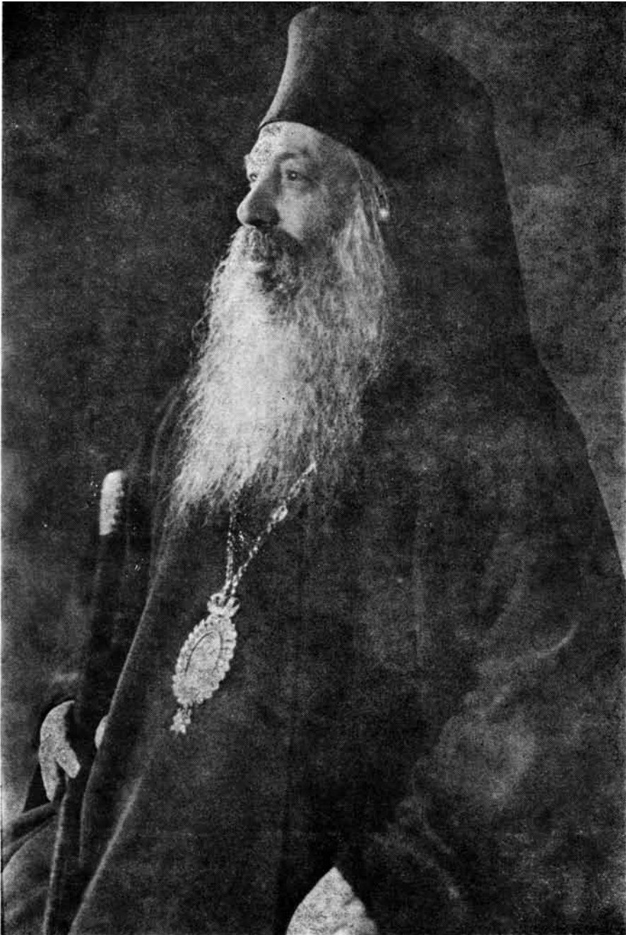
ΧΡΥΣΟΣΤΟΜΟΣ Α. ΠΑΠΑΔΟΠΟΥΛΟΣ ΑΡΧΙΕΠΙΣΚΟΠΟΣ ΑΘΗΝΩΝ ΚΑΙ ΠΑΣΗΣ ΕΛΛΑΔΟΣ