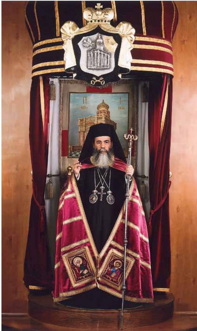
Η Α.Θ.Μ. Ο ΠΑΤΡΙΑΡΧΗΣ ΙΕΡΟΣΟΛΥΜΩΝ ΘΕΟΦΙΛΟΣ Γ΄