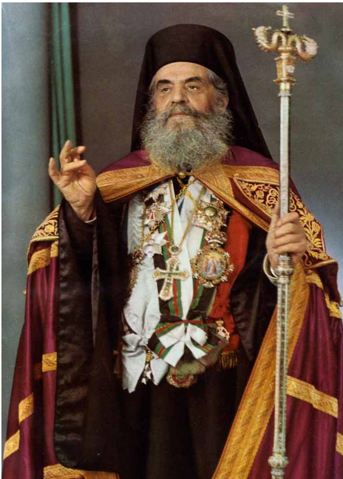
Η Α.Θ.Μ. Ο ΠΑΤΡΙΑΡΧΗΣ ΙΕΡΟΣΟΛΥΜΩΝ ΒΕΝΕΔΙΚΤΟΣ Α΄